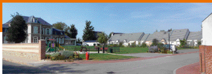
Villers Bocage, résidence du Manoir