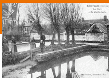
Boisrault, la mare et la mairie-école

L'objectif de cette action est de vous sensibiliser à la nécessité de développer une approche complète et structurée de vos projets d'habitat.