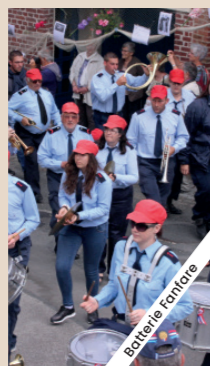
LA CLIQUE DES SAPEURS-POMPIERS DE SAINT VALERY SUR SOMME