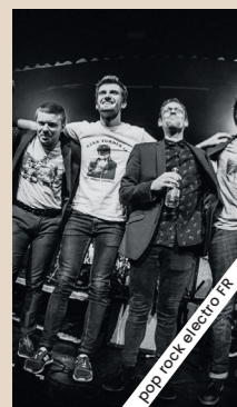
FOR THE HACKERS + DJ SET

Appréciée et attendue de tous, la Fête de la Musique fait son retour à Saint-Valery ! Deux commerçants se joignent à nous pour que toutes les générations puissent célébrer le premier rendez-vous incontournable de l'été. 4 lieux, 4 ambiances !