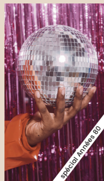
BLINDEST & KARAOKÉ ANNÉES 80

La Buvette de la Plage 📍 quai Jeanne d'Arc