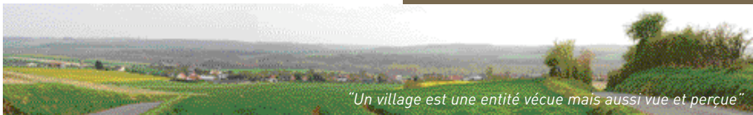
"Un village est une entité vécue mais aussi vue et perçue"