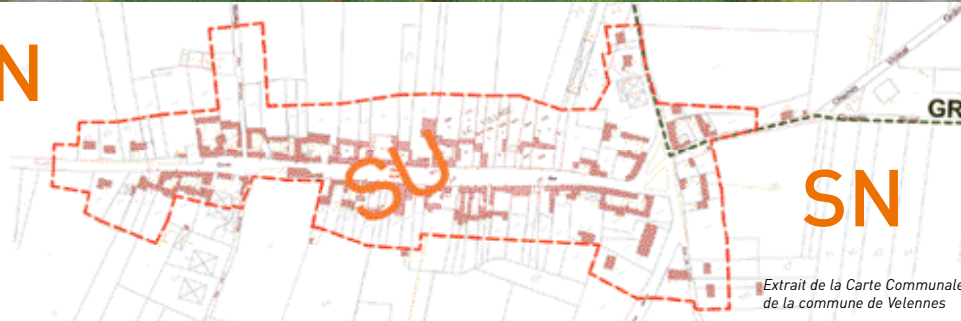
Extrait de la Carte Communale de la commune de Velennes