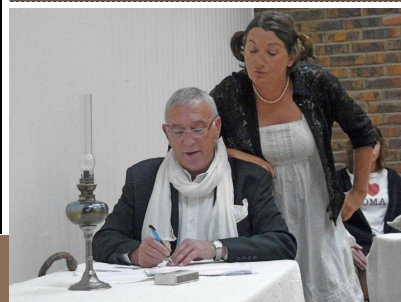
Photo d'un stage passé où deux acteurs en herbe (que vous reconnaîtrez peut-être) jouent avec brio « la peur des coups » de Courteline.

Dans le cadre de la Semaine de l'Environnement, la Société d'Archéologie et d'Histoire de Saint-Valery-sur-Somme, du Ponthieu et du Vimeu vous invite à la projection du film de Michel Quinejure « Baie des Songes » en présence du réalisateur. Baie des Songes est un portrait intime de la Baie de Somme. Entre souvenirs d'enfance, rencontres de hasard et quelques évocations personnelles en pellicule 9,5 et super 8, extraits de ses films de famille, Michel Quinejure nous emmène dans les dédales sinueux des rieux à marée basse ou à marée haute. Durée : 52'. Entrée gratuite.